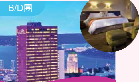
魁北克三角洲萬象酒店 Delta Hotel Quebec