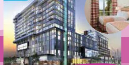
多倫多萬錦市萬豪大酒店 Markham Marriott Hotel