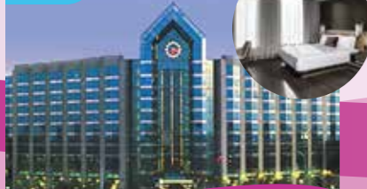
多倫多萬錦市希爾頓大酒店 Hilton Toronto/Markham Suite Conference Centre