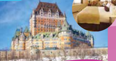
五星級豪華城堡酒店 Fairmont Le Chateau Frontenac

英法古戰場、蜿蜒的聖勞倫斯河等盡收眼底。隨後進入魁北克古城，城內錯落有致的700多座17-18世紀的唯美歐式建築，令您彷彿進入一個歐洲古鎮。您可充分享受逍遙的時光，盡情遊覽古城的上城：歷史悠久的古堡酒店、古老的達芙林木板觀景平台、聖勞倫斯河美景、藝術街、街頭藝術表演等。古城的下城是遊客必到之處：斷頭樓梯、加拿大第一條商業街、林立的酒吧和商鋪、石板小街、皇家廣場、北美第一座石建聖母教堂、巨型四季壁畫等等。晚餐後入住魁北克市的酒店。