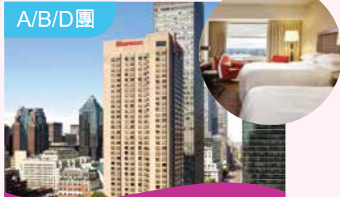
滿地可喜來登酒店 Montreal Sheraton Hotel