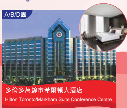
A/B/D團 多倫多萬錦市希爾頓大酒店 Hilton Toronto/Markham Suite Conference Centre