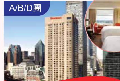
滿地可喜來登酒店 Montreal Sharaton Hotel