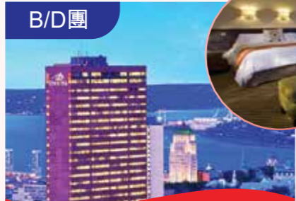
魁北克三角洲萬象酒店 Delta Hotel Quebec