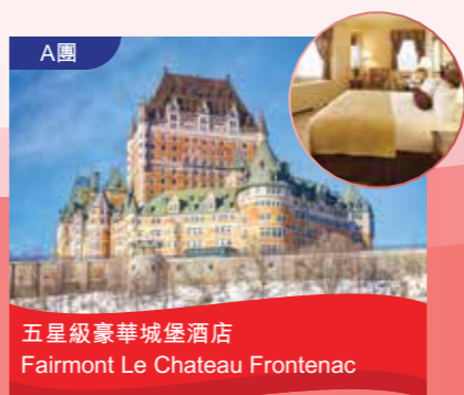
A團 五星級豪華城堡酒店 Fairmont Le Chateau Frontenac