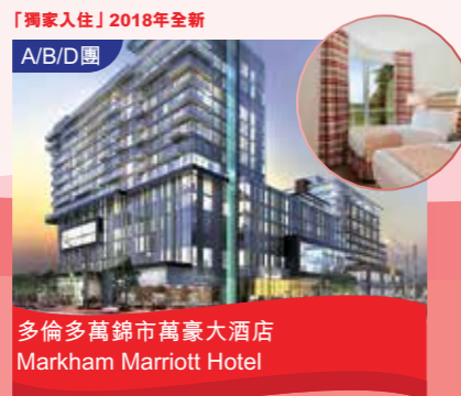
「獨家入住」2018年全新 A/B/D團 多倫多萬錦市萬豪大酒店 Markham Marriott Hotel