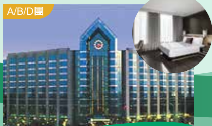
多倫多萬錦市希爾頓大酒店 Hilton Toronto/Markham Suite Conference Centre