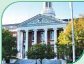
美國著名學府哈佛大學

清晨由多倫多出發，乘坐豪華旅遊巴士，前往安大略省東部的歷史名城—京士頓—加拿大的故都。這座美麗精緻的城市，帶著濃厚的歐洲色彩，擁有彌足珍貴的歷史遺跡，向遠方遊客述說著古老的城市故事。行程途經年代久遠的聯邦監獄、列為國家歷史文化遺址的加拿大第一總理故居、歷史悠久和聞名遐邇的皇后大學、古老的軍事炮台、1841年“曾經的”國會大廈、有“加拿大軍官搖籃”之稱的皇家軍事學院等著名古蹟。隨後出發前往首都渥太華，市區遊覽途經各國使館區、加拿大總理府和總督