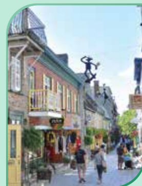
北美小巴黎—滿地可