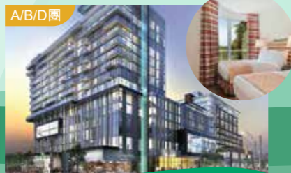
「獨家入住」2018年全新 多倫多萬錦市萬豪大酒店 Markham Marriott Hotel