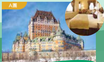
五星級豪華城堡酒店 Fairmont Le Chateau Frontenac