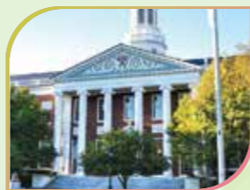
美國著名學府哈佛大學

早上離開酒店後，前往世界第一大名城，自譽“世界中心”之稱的美國最大城市紐約市，由專業導遊帶領貴賓作城市觀光，搭乘客輪觀看紐約市高樓林立的曼哈頓島區全景及代表美國國魂標誌的自由女神像。乘車途經美輪美奐名牌商店遍布的第五大道，登上氣度非凡的城中城洛克菲勒中心觀景臺，佔地八百四十三公頃的中央公園，送舊迎新的時代廣場，世界最大歌舞表演藝術中心百老匯大道，島內世界金融中心的華爾街都在我們觀光之列。旁晚餐後入住新澤西州豪華酒店。