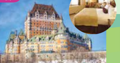
五星級豪華城堡酒店 Fairmont Le Chateau Frontenac