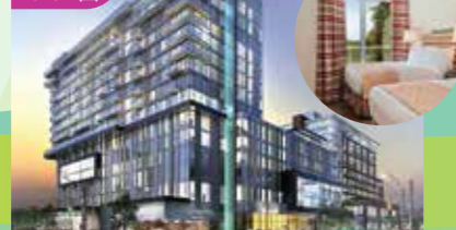
多倫多萬錦市萬豪大酒店 Markham Marriott Hotel