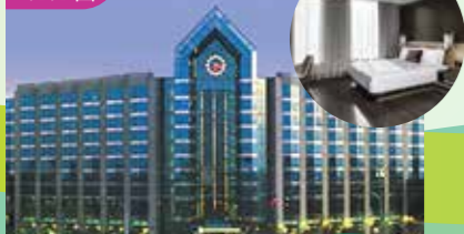
多倫多萬錦市希爾頓大酒店 Hilton Toronto/Markham Suite Conference Centre